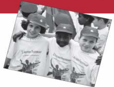
Jubiläumstage vom 3. - 6. April 2008

pax christi, der Frieden Christi, ist die bleibende Hoffnung und Vision auf Frieden unter den Menschen. Der Geist des Friedens und der Versöhnung aus dem Evangelium heraus ermöglichte angesichts der Katastrophe des II. Weltkrieges einen Neuanfang in der Beziehung ehemals verfeindeter Nationen: Die Versöhnungsgeste französischer Christen gegenüber den Deutschen führte zur Gründung der Internationalen katholischen Friedensbewegung PAX CHRISTI.